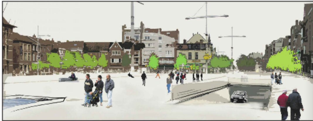
Zo zou de toegang tot de parking er kunnen uitzien.