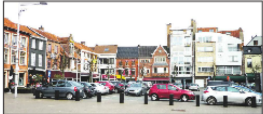
Dit beeld, geparkeerde wagens op de Markt, verdwijnt wellicht definitief.

vatbaar en financieel zouden er mogelijkheden zijn. En ook de meeste Eeklose beleidspartijen, op Groen na, tonen zich bereid de mogelijkheid te onderzoeken. Het debat is in elk geval, zoals hieronder zal blijken, volop gestart. We zetten de verschillende standpunten op een rijtje. Het is bijgevolg reeel dat we binnenkort onze auto onder de Markt zullen kunnen parkeren. (Ives Boone)