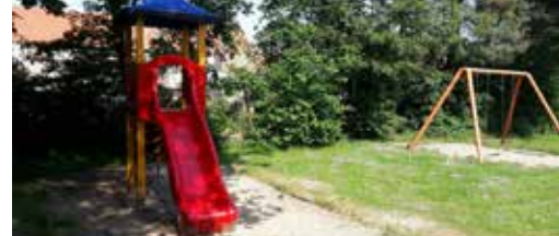
Stadsbomen als kindvriendelijke oase p. 3