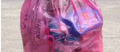
Minder afval met roze zak p. 2