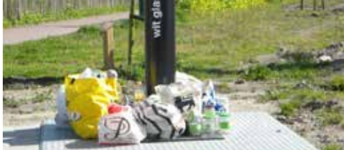
Zwerfvuil in Eeklo: een pest p. 2