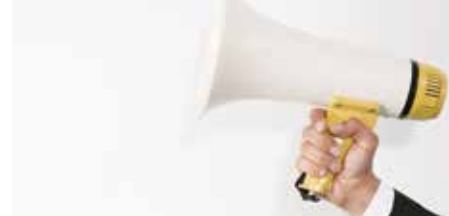
Verkavelingen: luister naar de bewoners! p. 3