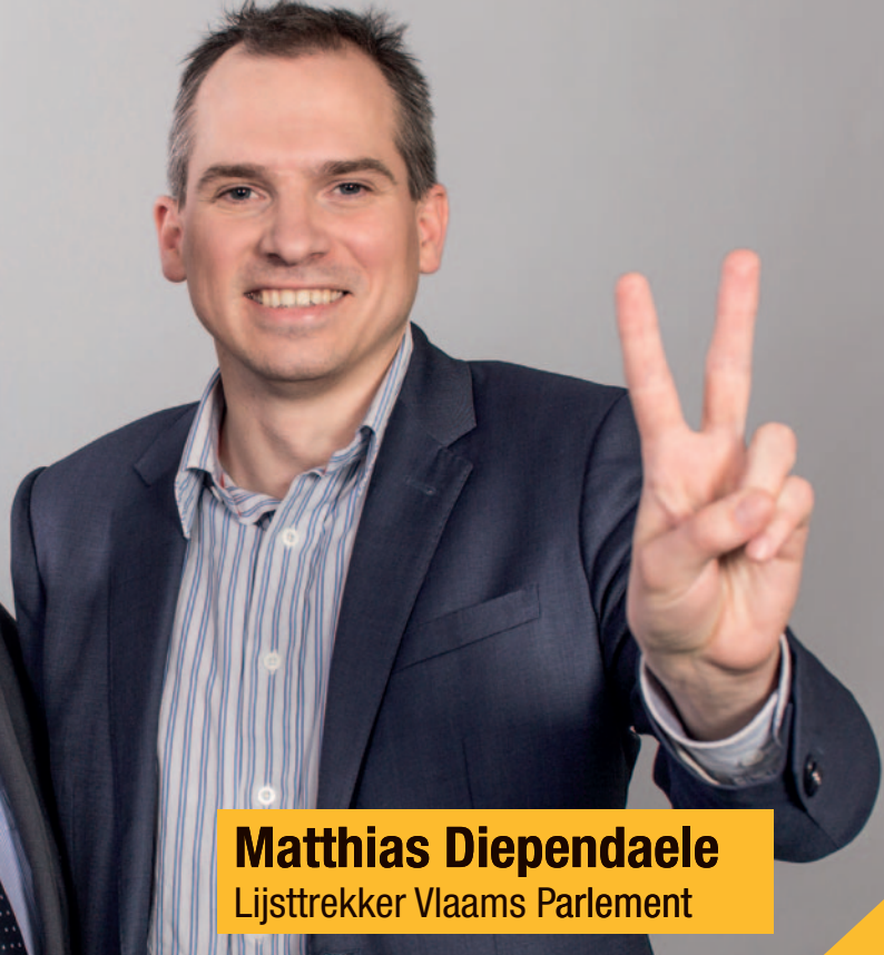
Matthias Diependaele Lijsttrekker Vlaams Parlement

Ik heb het te lang voor mijn ogen zien gebeuren: traditionele partijen doen alsof ze regeren, maar in werkelijkheid organiseren ze de stilstand. Gevolg? We gaan langzaam, bijna ongemerkt de berg af. Hoge werkloosheid, hoge belasting, hoge loonkost, hoge schuld. In ruil? Lage nettolonen, lage pensioenen, een sociale zekerheid die alsmat minder zeker is.